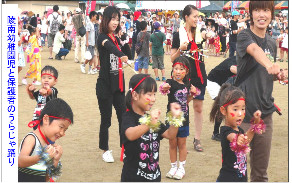
陵南幼稚園児と保護者のつらじや踊り

少し雨の心配がありましたが「おかやま木堂ふるさとまつり」は、7月27日(日)、吉備中学校で盛大に開催されました。午後5時頃から陵南幼稚園の園児と先生、保護者約200人で暑い中で、元気に「つらじや踊り」を披露し、大きな拍手を受けました。雨が本降りとなった