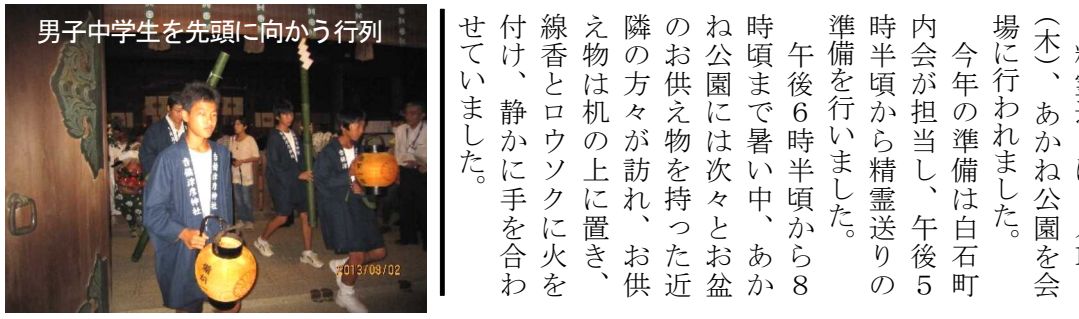
男子中学生を先頭に向かう行列

精霊送りは8月15日(木)、あかね公園を会場に行われました。今年の準備は白石町内会が担当し、午後5時半頃から精霊送りの準備を行いました。午後6時半頃から8時頃まで暑い中、あかね公園には次々とお盆のお供え物を持った近隣の方々が訪れ、お供え物は机の上に置き、線香とろうソクに火を付け、静かに手を合わせていました。