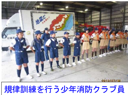
規律訓練を行う少年消防クラブ員