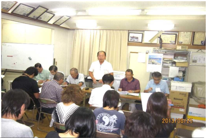
町内会役員・各団体代表者約40名が参加した合同役員会

【印刷機使用について】のお願い。講習を受けた方以外は印刷機の使用をしないで下さい。もし、印刷をする必要がある場合は、楠木二五四一五九七八までご連絡下さい。故障が起った場合も同様です。