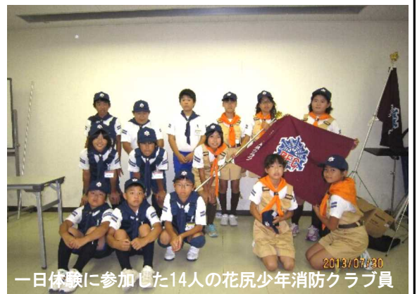
一日体験に参加した14人の花尻少年消防クラブ員