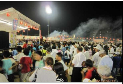
多くの人で賑わった木堂まつり

少し雨の心配がありましたが「おかやま木堂ふるさとまつり」は、7月27日(日)、吉備中学校で盛大に開催されました。午後5時頃から陵南幼稚園の園児と先生、保護者約200人で暑い中で、元気に「つらじや踊り」を披露し、大きな拍手を受けました。雨が本降りとなった