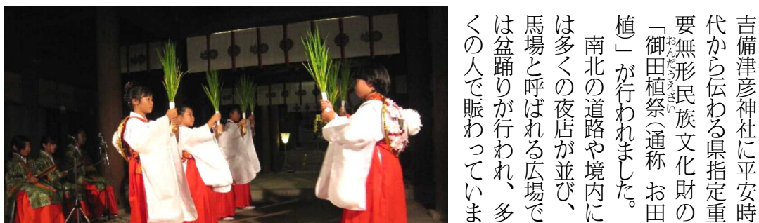
女子中学生による古式にのっとった「田舞」

「御田代祭」に移り、男子中学生らを先頭に氏子や宮司が続ぎ、6本の稲束を御羽車というみこしに乗せて二つの池まで運び設けられた祭壇に奉納し、今年の豊作を祈願しました。