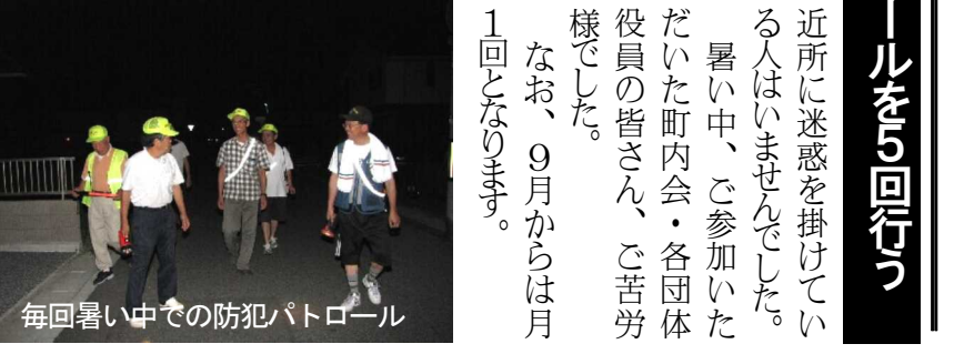
毎回暑い中での防犯パトロール

8月は3日(7名参加)・10日(7名参加)・17日(9名参加)・24日(12名参加)・31日の土曜日に延べ35人が参加(31日は除く)して防犯パトロールを行いました。雨はほとんど降らなかったものの、連日大変暑い日が続き、参加した町内会・各団体の役員の方は大変だったと思います。そのような中、公園やコンビニ、高架下などは重点的に見回りました。花火を家族で見ている人はいましたが、