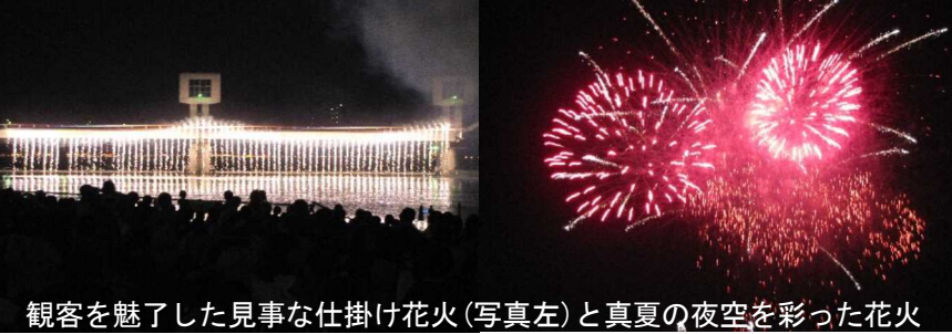
観客を魅了した見事な仕掛け花火(写真左)と真夏の夜空を彩った花火

桃太郎まつりは8月3日(土)・4日(日)の両日、岡山市街地を中心に開催されました。「笑顔とともに40回、夜空に咲かす歴史と文化」テーマにした「花火大会」は、8月3日、午後7時30分より旭川河原において開催され、約4千発の花火が打ち上げられ、河川敷を埋め尽くした観衆から赤や黄色の大輪が大音響とともに咲き競うたび、大きな歓声と拍手が起っていました。そして、節目を記念して、瀬戸大橋をイメージした約80坪の仕掛け花火も披露されました。また、旭川堤防周辺には多くの夜店が並び、賑わっていました。「つらじやおどり」は