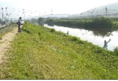
草を刈りすっきりした笹ヶ瀬川堤防