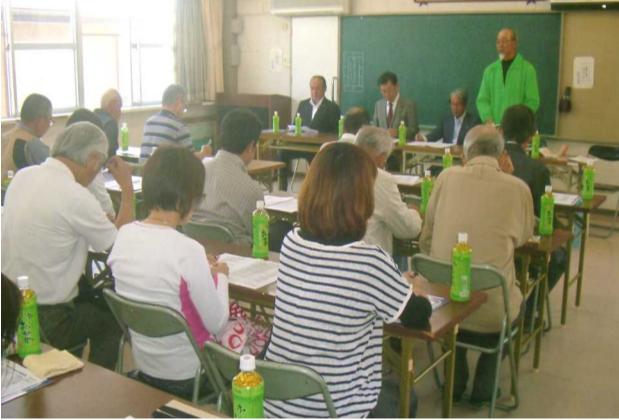
各町内会の交通安全対策協議会役員35名が参加し開催された総会

陵南学区交通安全対策協議会総会は、各町内会より選出された役員35名が参加して、5月12日(日)、午後1時からコミュニティハウスの2F会議室に於いて開催されました。