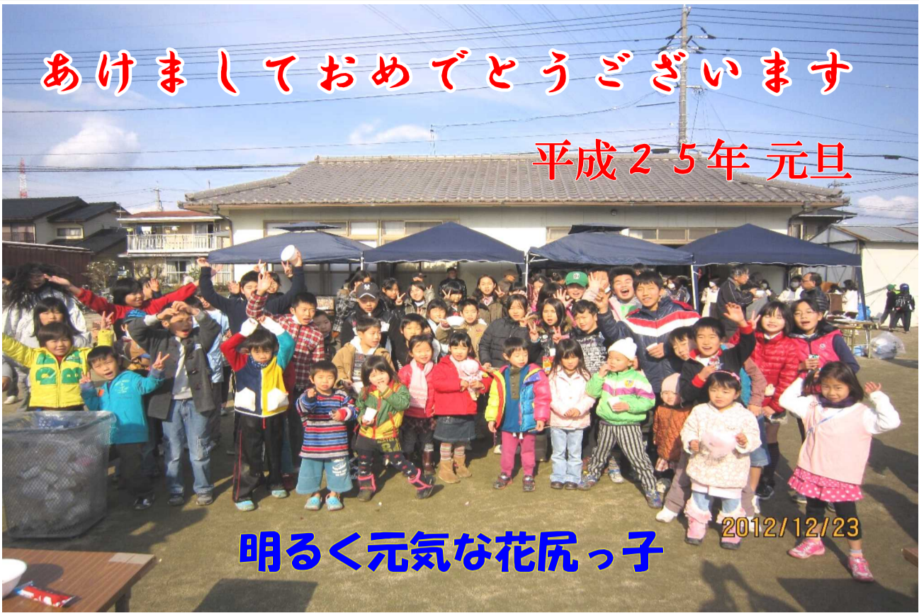
明るく元気な花尻っ子