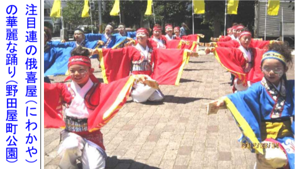
注目連の俄喜屋(にわかや)の華麗な踊り(野田屋町公園)

「うらじゃおどり」は4日・5日の両日、市役所筋会場や岡山駅前広場会場を始め、15会場で連日30℃を超す炎天下の中、延べ6千7百人(148連)が参加して開催されました。