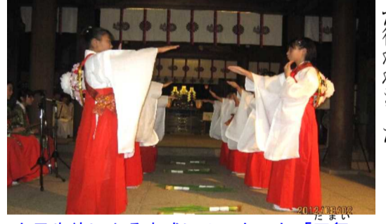
女子生徒による古式にのった「田舞」