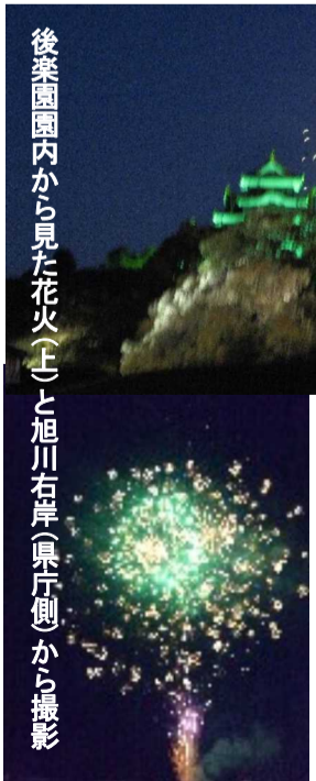
後楽園内から見た花火(上)と旭川右岸(県庁側)から撮影

また、その他にも、後楽園やビルの屋上、橋の上など様々な場所でも岡山市の花火を楽しみました。