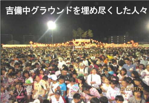
吉備中グラウンドを埋め尽くした人々

その頃会場は左の写真のように超満員、抽選が行われるたびに、拍手と歓声が起っていました。