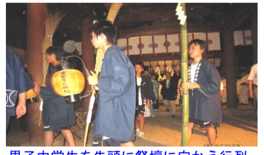
男子中学生を先頭に祭壇に向かう行列

引き続き、小中学校の女子生徒による古式にのった「田舞」(田植えの様子を表現した舞が奉納されました。約1時間で舞は終わり、その後、「御田代祭」に移り、男子中学生らを先頭に氏子や宮司が続き、6本の稲束を御羽車というみこしに乗せて二つの池まで運び設けられた祭壇に奉納し、今年の豊作を祈願しました。