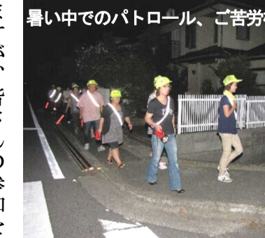
暑い中でのパトロール、ご苦労様でした

暑い中、夏休み中の防犯パトロールに52名が参加しました「ご苦労様でした 夏休みに入る直前の7月16日(土)に行ったのをはじめ、8月25日までの間、6回行い、延べ45人が参加して防犯パトロールを実施しました。幸い雨はほとんど降らなかつたものの、連日大変暑い日が続き、参加した町内会の役員、各団体の役員の方は大変だったと思いつつます。そのような中、公園やコンビニ、高架下などは重点的に見回りました。花火を家族でしている人はいましたが、近所に迷惑を掛けている人はいませんでした。暑い中、ご参加いただいた町内会役員、各団体役員、皆さん、ご苦労様でした。なお、9月から防犯パトロールは週1回となり、その中で、10月20日はききょう町と編集委員会、11月17日はみどり町と体協・消防、1月19日は本町と育成会、2月16日はあかね町とソフト監督・コーチ、3月16日はききょう町と編集委員会です。お盆の精霊送りに参加をお願いします。なお、次回は9月15日(土)、担当はあかね町役員とソフト監督・コーチの皆さんです。そして、10月20日はききょう町と編集委員会、11月17日はみどり町と体協・消防、1月19日は本町と育成会、2月16日はあかね町とソフト監督・コーチ、3月16日はききょう町と編集委員会です。