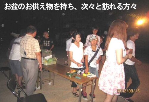
お盆のお供え物を持ち、次々と訪れる方々