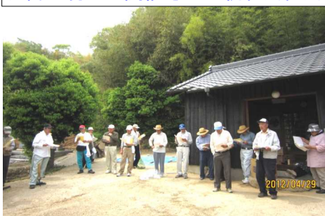
お宮の境内で開催された親和会総会