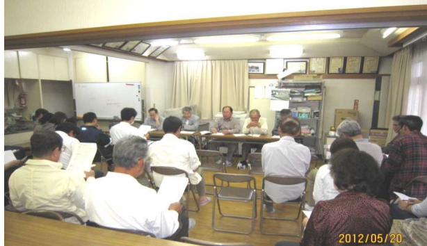
約40人が出席して開催された夏まつり実行委員会

お楽しみ券の販売は6月16日(土)より販売を開始します。販売価格は大人券700円、子ども券を500円とします。ご家庭には理事・班長さんが販売にお伺いしますのでご協力ください。お楽しみ券は抽選券となっておりますので、当日持参下さい。なお、賞品については、町内新聞7月号でお知らせいたします。