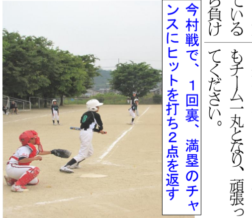
今村で、1回裏、満塁のチャンスにヒットを打ち2点を返す

去る5月20日(日)、操車場跡地にて西陵御吉杯球技大会が行われました。 1試合目、田中野田対戦しましたが緊張していることもあり残念ながら負けてしまいました。 2試合目、今村と今村で、1回裏、満塁のチャンスにヒットを打ち2点を返す