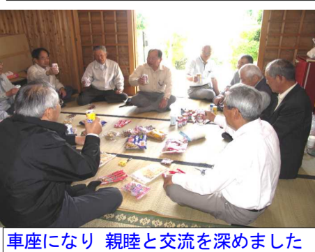
車座になり 親睦と交流を深めました