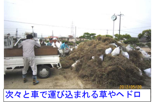
次々と車で運び込まれる草やヘドロ

朝8時には町内それぞれの集合場所です土木委員から注意事項などの説明、出席確認を行った後、早