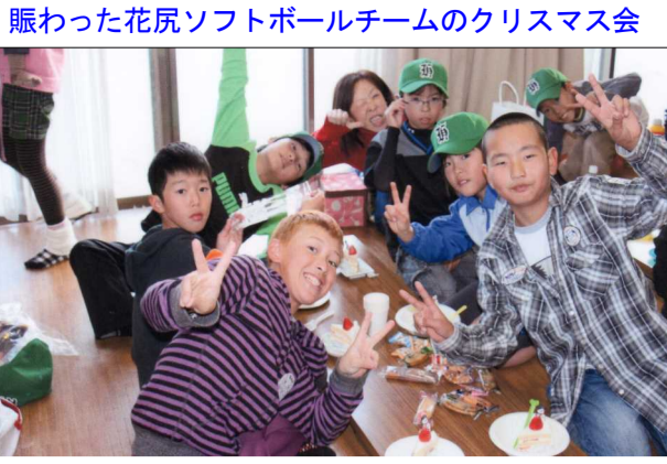
賑わった花尻ソフトボールチームのクリスマス会

今年一年間を振り返った時、試合では十分な結果を出していませんが、チーム内の輪はどこもチームにも負けないものを持っており、喜びとともに出来る大家族のようなチームであると思っています。