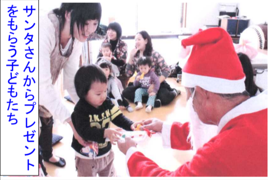
サンタさんからプレゼントをもらう子どもたち

来年の活動は1月17日(火)午前10時より花尻集会所にてお正月遊びなどを行う予定です。