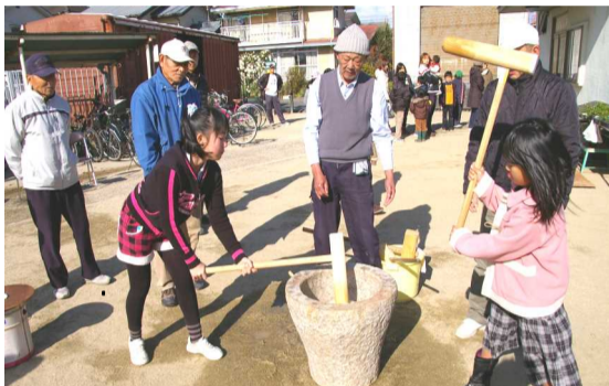
寒い中、頑張って餅つきを楽しむ子ども達

12月25日(日)、花尻フェスタ(主催 編集委員会)を170人が参加し、花尻公園で開催しました。当日は少し風があり、寒い日でしたが、午前