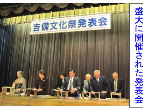
盛大に開催された発表会

19日(土)は朝からの雨にもかかわらず多くの人が公民館を訪れ、駐車場は満車の状況であり、館内では講座生による発表会や展示物が所狭しと飾られ、関係者、地域の人達で賑わっていました。