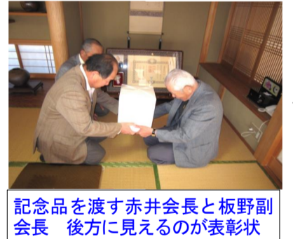
記念品を渡す赤井会長と板野副会長 後方に見えるのが表彰状