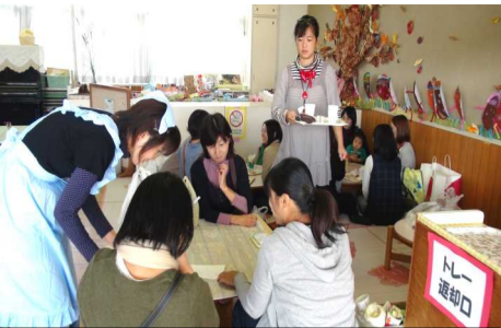
喫茶コーナーも盛況 1杯50円は安い！

朝早くから保護者を始め、地域の方、近隣幼稚園の保護者の方など多くのお客様が詰めかけ賑わいました。陵南幼稚園のPTA活動は、会長を軸として「楽しく、一致団結して活発に」行われており、バザーは活動の中の一大イベントと言えます。