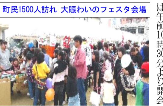
町民1500人訪れ 大賑わいのフェスタ会場

地区の史跡などを紹介していました。そして、中国学園大学の学生による和太鼓の演奏、街角での紙芝居、撫川うちわの実演制作、庭瀬城趾周辺でのイベント等々多くの出し物で賑わっていました。