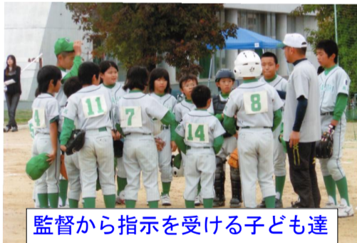
監督から指示を受ける子ども達