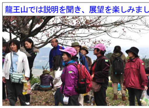
龍王山では説明を聞き、展望を楽しみました

旧道をまっすぐ西に進み、途中右に曲がり、古代吉備文化財センターに向かいました。文化財センターでトイレ休憩。しかし、文化財センターに来るのが初めての人もあり、興味深く見学していました。約30分ぐらいの休憩となり、黒住教の駐車場に向けて出発しました。到着後は、参加者一人ひとりに飲み物とパンが配られ、ここで一応の解散となりましたが、多くの人が龍王山に向かい、ここでは「吉備の中山を守る会」の方から説明を聞き、龍王山からの展望を楽しみました。