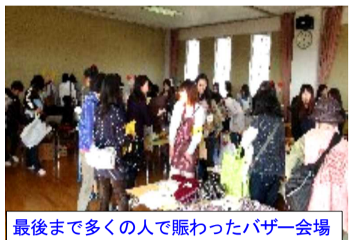
最後まで多くの人で賑わったバザー会場