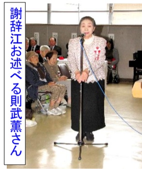
謝辞江お述べると武薫さん

続いて、主催者を代表して、宗光吉備地域センター所長より市長のメッセージが朗読されました。次に、記念品贈呈に移