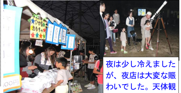
夜は少し冷えましたが、夜店は大変な賑わいでした。天体観測も行われました