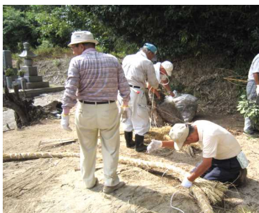
土俵作りを行う親和会の皆さん