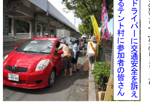
ドライバークラスに交通安全を訴えるテント村に参加者の皆さん

秋の交通安全運動(9月21日〜30日)期間の9月22日(木)午前10時より、学区交対協、交通安全母の会、老人クラブの方々の会、老人クラブの方々の会、約30名が参加して、川内地内の八幡神社北川の県道で西署の方の協力をいただき、テント村を設け、警察官が次々と誘導する車に「気をつけて運転して下さい」と声をかけ、一人ひとりのドライバークラスに交通安全グッズを手渡ししていました。