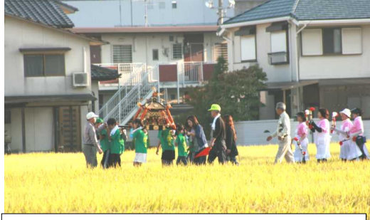
刈り取り前の町内を練り歩くみこしの行進