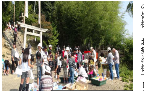
賑わったお宮での模擬店