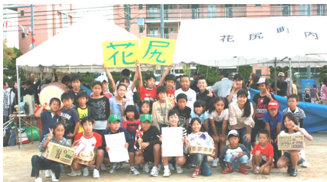
競技・応援の部とも2位となり、賞状を持って集合写真

午後の部の最初の得点競技は障害物競走、2位と健闘し、続く小学生町内対抗リレーでは3位でした。続く得点競技は花尻が最も得意な百足競走、男子は1位、女子は2位でしたが、総合は1位となりました。