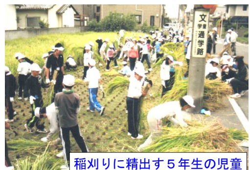
稲刈りに精出す5年生の児童

また、リズムの年少児の「たからさがしてゴー」、年長児の「だいきー!ニッポン」では全園の踊りを披露、年少児の「マルマルモリモリ」は、親子のふれあいが、素晴らしい出来映えに感心していました。