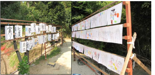
お宮の境内には子ども達が作った行灯、ポスターが飾られ、参拝者の目を楽しませました