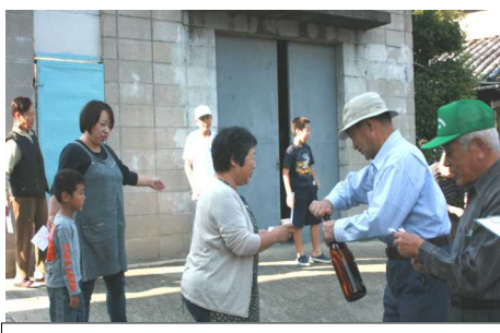
途中では多くの方の出迎えがありました

出迎えがあり、奉納金も賜り、その方々には富くじ(抽選券)がわたされ、お酒が振り舞われました。行進は約40分であかね公園に到着し、参加者にジュースが配られました。しばらく休憩した後、午後4時あかね公園を出発し、あかね町、ききょう町、みどり町と回り、この地域でも、多くの方々の出迎えがありました。午後5時前にみこしの行進は無事、ききょう公園に到着しました。到着後、子ども達には、お菓子が配られ、だんじり・みこしの片付けも行われました。その頃には映画会や夜店の準備も全