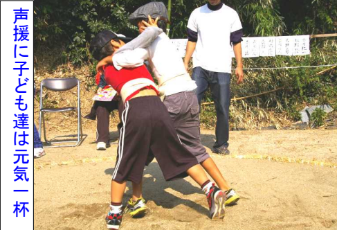
声援に子ども達は元気一杯

事前に箱に入れた富くじの半券の番号が読み上げられ、賞品が当たった方には拍手が送られました。また、綿菓子