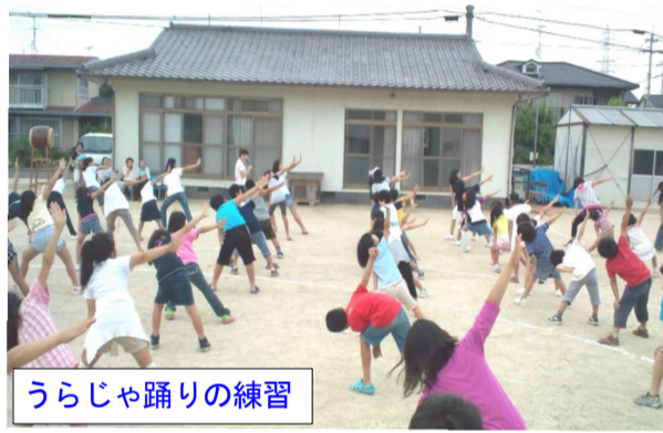
うらじゃ踊りの練習