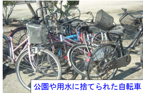
公園や用水に捨てられた自転車