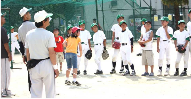
ソフトボール部はあかね公園で新人部員募集を呼び掛け、楽しいイベントを行いました。

体験後、参加者にはかき氷とポップコーンが振る舞われました。参加された皆さん、お疲れ様でした。花尻ソフトボール部では、ソフトボールを通じ、技術の上達は勿論、子ども達の健全育成をめざしながら活動を進めています。まだまだ部員を募集しています。一日体験や見学だけでも大歓迎です。練習は毎週土・日曜日、あかね公園で行っています。ぜひ、あかね公園に来てみてください。お待ちしております。なお、お問い合わせは、河原宅255-4685まで。