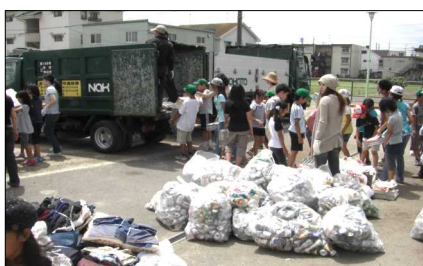
回収車に積み込みを行う子ども達

参加した子ども他はジュースが配られました。ご協力頂いた皆さん、ありがとうございました。次回は9月19日の予定です。