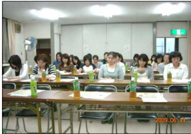
30人が参加して開催された母の会総会

交通事故多発交差点の説明や、西警察署管内の人身事故・物損事故件数、学区別交通事故発生状況の説明もありました。