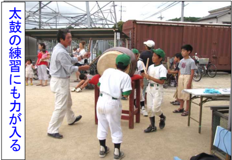
太鼓の練習にも力が入る