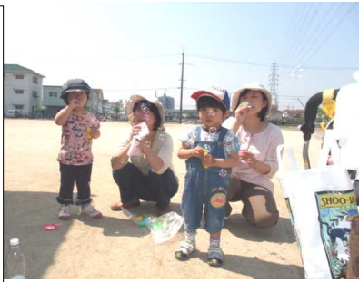
シャボン玉をして遊ぶ親子