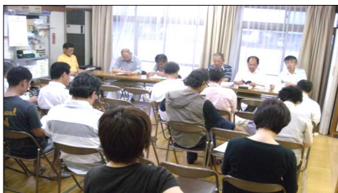
第2回の実行委員会には40人が参加

また、下記のように「会場案内図(夜店やテントの配置図)」や「電源の配線図」、「備品の借り入れの任務分担」等についても協議しました。