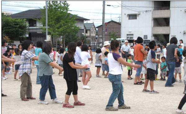
約140人が参加して行われた夏まつり踊りの練習