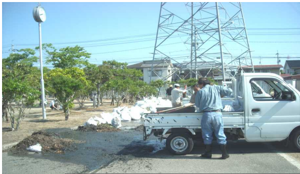
車で次々と運び込まれるヘドロやごみ