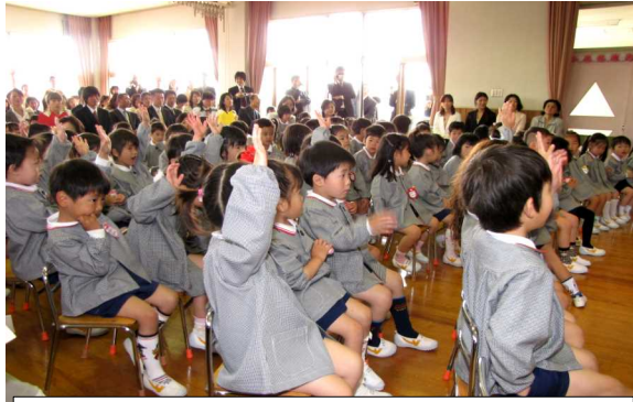
園長先生のお話により「ハイ」の返事

続いて、それぞれの組の担任の先生が紹介されました。お祝いのことば、来賓紹介と続いた後、みんなで「パンダ・うさぎ・コアラ」を先生に合わせて歌いました。次に、陵南幼稚園の歌を歌い、閉会のことばで入園式は終わりました。