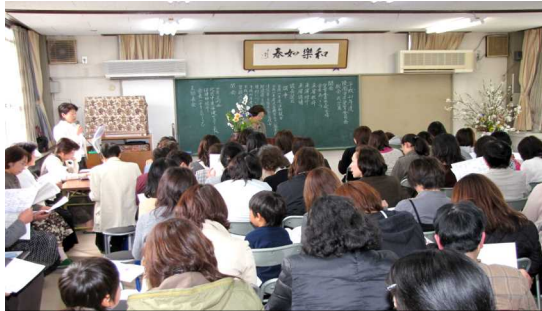
約80人の参加のもと、開催された愛育委員会総会