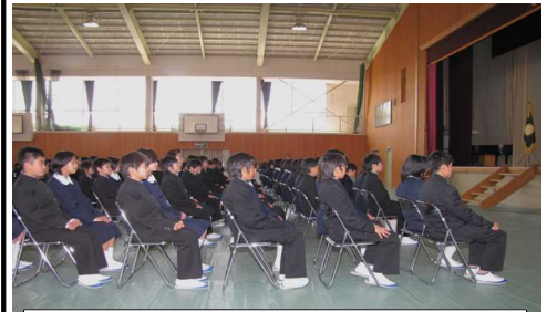
新1年生は少し緊張していました

て欲しいという願いを込めて、日本の国からいただいた教科書を今日、配りました。ちよつと見てみましょうか、算数の教科書、音楽や学校の生活という本もあります。袋に入れてお渡しします。先生の教えて下さることをよく聞いて一生懸命勉強して下さい。また、遊び時間もありますから、お友達と仲よく元気に遊びましょう。給食や遠足などまだまだ楽しいことが一杯あります」とのあいさつがありました。続いて、担任の先生の紹介があり、それに応え、1年生から「よろしくお願ひします」と、元気のよい返事がありました。次に、PTA会長のお