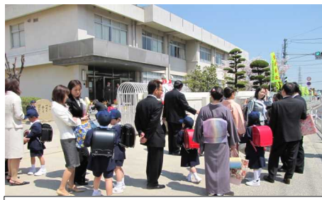
校門の前では保護者と一緒に記念撮影