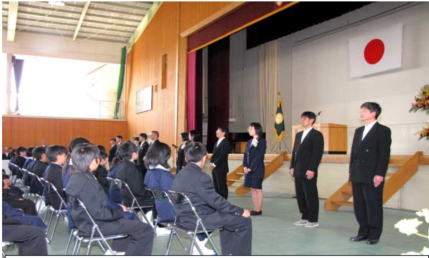
12人の1年生担当職員(先生)が紹介されました

ずの成果をあげてその日を終えたと思っていまして、生徒達の目標は私の基準より高く、あれこれと反省点があり、満足がいかなかったようです。暗い雰囲気になった時、ある人がこう言いました。『なあ、みんな、競走しよう!』もちろん、明日の研修をより良いものにするためです。そのためにグループやクラスで競走しようというものです。共通の目標に向かって競走することは、『協同的競走』とも言えるもので、高次な競走であります。『なあ、みんな、競走しよう!』忘れないことばとなりました。皆さんには、このような先輩の思いを引き継ぎ、立派な中学生になる競走をしていただきたい。そして、吉備中学校をますます立派な学校にして欲しい」との式辞がありました。次に、在校生を