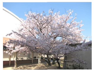
入学式を祝うかのように満開に咲いた体育館前の桜