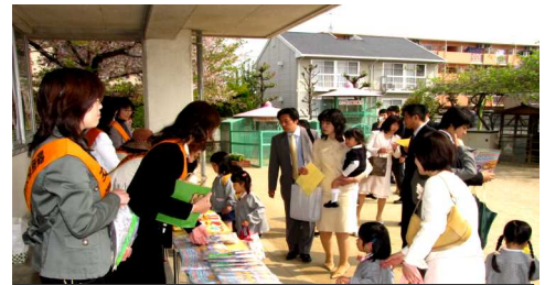
入園した園児に陵南区交通安全母の会から園児に交通安全グッズが贈られました

続いて、それぞれの組の担任の先生が紹介されました。お祝いのことば、来賓紹介と続いた後、みんなで「パンダ・うさぎ・コアラ」を先生に合わせて歌いました。次に、陵南幼稚園の歌を歌い、閉会のことばで入園式は終わりました。