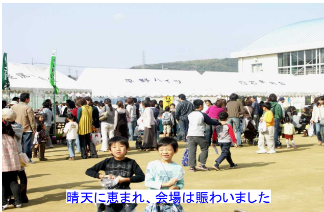
晴天に恵まれ、会場は賑わいました

第9回陵南フェスタ(主催 学区子ども会育成会、小 学校PTA、学区体協、小 学校 後援 学区連合町内会、 学区コミュニティ協議会) は晴天に恵まれた11月11日 (日) 午前9時30分より陵 南小学校において、学区の 老若男女約2000人が参 加して盛大には開催されま した。