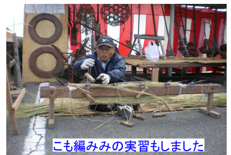
こも編みみの実習もしました