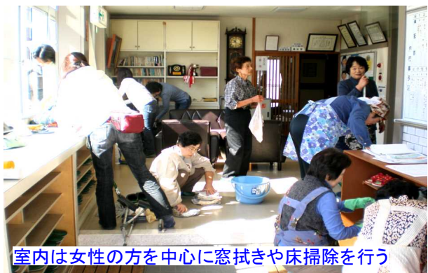
室内は女性の方を中心に窓拭きや床掃除を行う