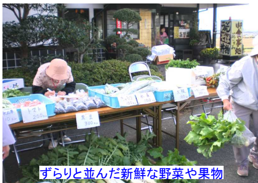
ずらりと並んだ新鮮な野菜や果物

陵南学区では西花尻の「花いずみ」で西花尻町内会のご協力で「昔の農機具等の展示」や「地元 取れたての新鮮野菜や果物」を販売しました! いずれも大盛況 ほとんどの品物が完売しました