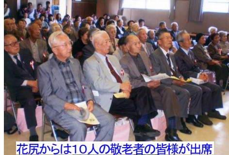
花尻からは10人の敬老者の皆様が出席

太鼓」迫力ある演技に大きな拍手がありました。 次の出し物は、エンジェル劇団の皆様による「歌と踊り、芝居」が披露され懐かし