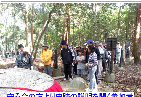
守る会の方より史跡の説明を聞く参加者

守る会の方より説明を聞きながら御陵と鏡岩くさいぼう跡と環状石離く御陵へと古代に思いをはせながら、おいしい空気を胸一杯に木々の紅葉も眩しいぐらいにきれいな中をマイペースで散策しました。天候にも恵まれ本当に有意義な健康ウォークでした。