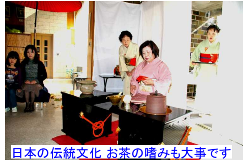
日本の伝統文化 お茶の嗜みも大事です

大集会室では、大正琴やコーラス、銭太鼓、謡曲、傘踊り、箏曲、日舞、カラオケ、太極拳、詩吟、フラダンス、着物の着付け、民謡、社交ダンス、フォークダンス等々日頃の練習の成果を発表しました。会場からは演技が終わるたびに大きな拍手