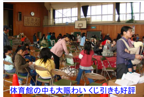
体育館の中も大賑わいくじ引きも好評

また、愛育委員会は日赤とタイアップし、献血やメタポリックシンドロームの検査、乳ガンモデルも行われ、健康面のPRを行っていました。体育館の中ではバ