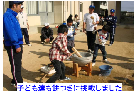
子ども達も餅つきに挑戦しました

校庭狭しと張られたテントには各団体、町内会が出店した野菜や果物、バザー、焼きそば、綿菓子、うどん、カレーライス、生卵、揚げたこ焼き、おでん、おにぎり等の店がずらりと並び、元気な掛け声でPRしている店もありました。また、学区育成会 は恒例の餅つきも行って、つきたての餅は ぜんざいやきなこもちにして売られ、すぐ売り切れとなっていました。