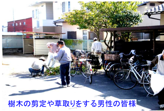
樹木の剪定や草取りをする男性の皆様

室内では、1・2階に分かれ、2階では会議室の床やガラス拭き、1階では和室や調理室、トイレ、玄関の清掃、ガラス拭きを行いました。約1時間で室内外とも見違えるようにきれいになりました。ご苦労様でした。