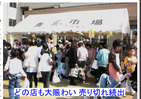
どの店也大賑わい 売り切れ続出

また、愛育委員会は日赤とタイアップし、献血やメタポリックシンドロームの検査、乳ガンモデルも行われ、健康面のPRを行っていました。体育館の中ではバ