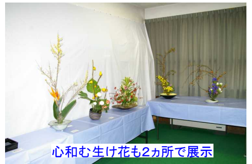
心和む生け花も2カ所で展示

また、茶席も2カ所あり、大変な賑わいがありました。そして、展示の部では、1階では、短歌や川柳、アートフラワー、盆栽、押絵、鯉山彫、パステル画、絵手紙、パッチワーク、押し花、手描き友禅、水墨画、2階では、撫川うちわ、書道、木彫り、書芸、和裁、俳句、手編み、ロマン