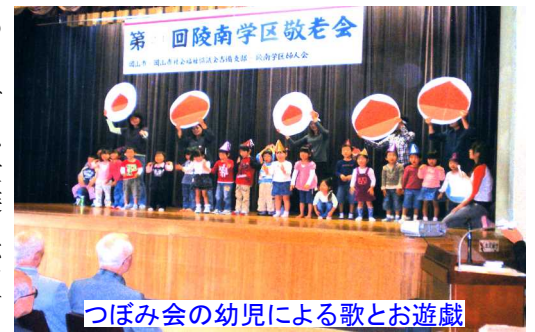
つぼみ会の幼児による歌とお遊戯

「水戸黄門」、黄門様ご一行が岡山を訪れ、悪代官を退治する、という物語、楽しい芝居に笑いと拍手がありました。 次は、誰もが知る時代劇「水戸黄門」、黄門様ご一行が岡山を訪れ、悪代官を退治する、という物語、楽しい芝居に笑いと拍手がありました。 次はつぼみ会の幼児による歌と踊りが披露されました。可愛い遊戯に誰もがにっこり、その後、敬老者の皆様には婦人会手作りのクッキーが配られました。 続いて婦人会の皆様による恒例の踊り「花笠音頭」会場狭しと踊りが繰り広げられました。 最後に婦人会の輪唱に続いて、全員で「四季の歌」を歌い全ての日程を終了しました。