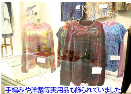
手編みや洋裁等実用品も飾られていました

それぞれのコーナーには展示品の説明も行われ、熱心に聞いていました。講座のお問い合わせは吉備公民館(29312170)まで。