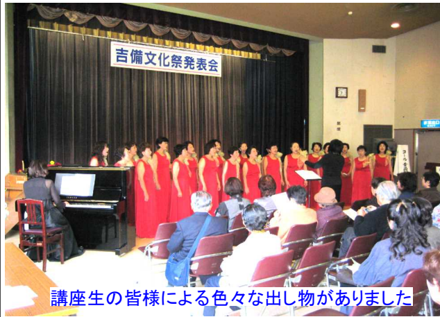
講座生の皆様による色々な出し物がありました

また、茶席も2カ所あり、大変な賑わいがありました。そして、展示の部では、1階では、短歌や川柳、アートフラワー、盆栽、押絵、鯉山彫、パステル画、絵手紙、パッチワーク、押し花、手描き友禅、水墨画、2階では、撫川うちわ、書道、木彫り、書芸、和裁、俳句、手編み、ロマン