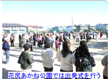
花尻あかね公園では出発式を行う

全のための交通整理や警備は地元消防団の吉備・白石分団、交通安全母の会、愛育委員会の皆さんで行いました。参加された皆さんには緩やかなコース(黄色シール)、きついコース(赤色シール)に分かれて頂き、楽しく途中の景色を眺めながら全員無事に黒住教第2駐車場に到着しました。ここで参加者にパンと飲料が配られ、一息入れて、11時45分頃に10人から15人程度の班編成を行い、吉備中山を