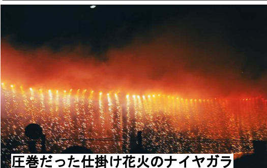
圧巻だった仕掛け花火のナイヤガラ

旭川の両岸には屋台が並び、堤防は人の山、午後7時30分より花火大会は始まりました。約5000発の花火が打ち上げられ、観衆からは大きな歓声と拍手が起こっていました。中でも、仕掛け花火は美しく、しばし、真夏の夜の祭典を楽しんでいました。