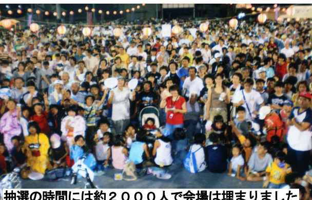
抽選の時には約2000人で会場は埋まりました

おかやま桃太郎まつりは 8月4日・5日・8日に開催 花火大会は台風の影響で8月8日に行う