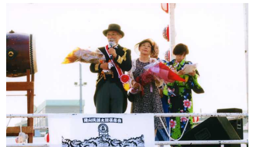
やぐらの上で挨拶する木堂先生ご夫妻

様による民謡太鼓が披露されました。また、地元の方を中心に、吉備首頭、備前太鼓うた、やとさ踊り、ビューテフルサンディなどがやぐらを囲んで踊られました。