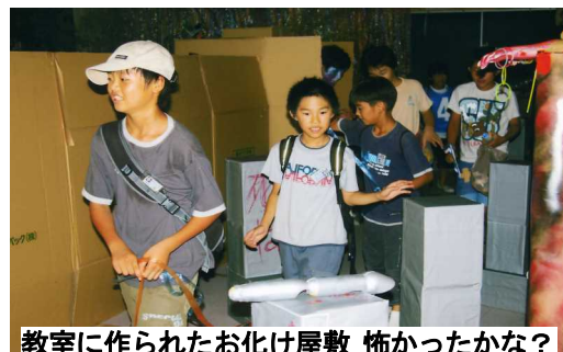
教室に作られたお化け屋敷 怖かったかな?