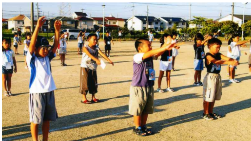
元気にラジオ体操する子ども達(ききょう公園)