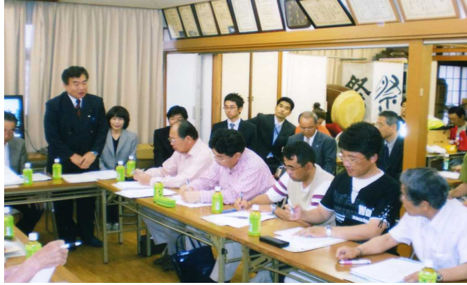
約40人が参加し、開催された連合町内会・各団体の合同会議

尻集会所に於いて、学区連合町内会・各団体代表者との合同会議を開催し、①ケーブルテレビを活用した「安全・安心ネットワーク」、②「赤い羽根安全・安心まちづくり支援事業」、③まちかど博物館等について協議しましたので報告いたします。また、この会議には地元の県議や市議、そして、岡山市情報企画課とオニビジョンからの出席がありました。