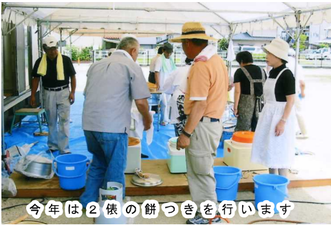
今年は2俵の餅つきを行います

この度も餅投げ用の紅白もちつきを7月13日(金)午後1時よりききよ公園において行います。町内役員、各団体役員を始め、町内の皆様でご参加できる方のご協力をお願いします。また、蒸し器や餅つき器等の用具借用を合わせてお願いいたします。