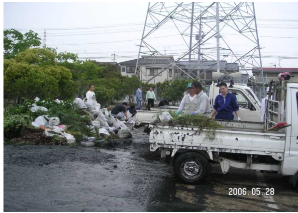
次々とトラックで運ばれるヘドロや空き缶等のごみ

公園では次々と運び込まれるごみなどで見える見るうちに一角は山と化していきまされた。また、ゴミの分別も土木委員の方で徹底して行なわれました。約2時間で清掃作業はほぼ終わり、その後、車や用