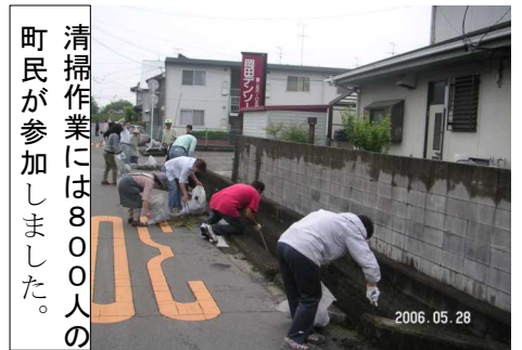
清掃作業には800人の町民が参加しました。

具の水洗いをしました。午前10時30分頃には全ての作業が終わり最後の点検をして解散しました。清掃に参加された皆さん、ご苦労様でした。