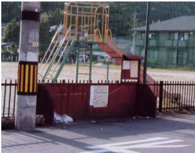
改修が急がれるごみステーション

部会としては、ハード面のごみステーションの改修については役員会に報告する。ソフト面では啓発活動を徹底すると共にオーナーの方や管理人に要請することなど決めました。