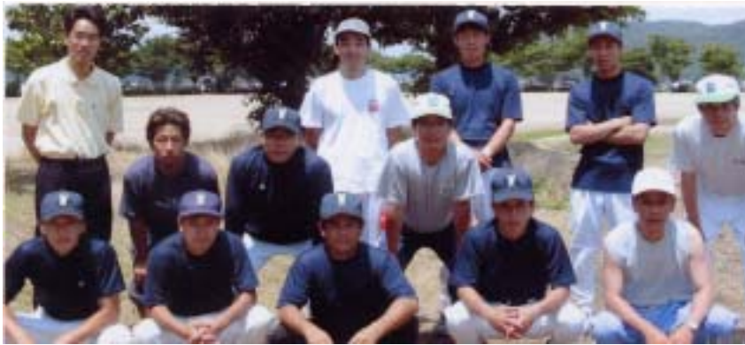
出場された選手の皆さん、秋の大会では頑張ってください。

「学区体協主催」 ソフトボール大会 開催される 花尻チーム惜しくも 決勝トーナメント進出できず 去る6月29日(日) 陵南学区 体協主催、第45回ソフトボール 大会が撫川グラウンドで開催され ました。 花尻チームは予選リーグで白 石・グリーンハイツチームと対戦 し、1勝1敗の成績で決勝トーナ メント進出が期待されましたが、 得点の関係で惜しくも決勝ト ーナメント進出はできませんで した。 ご参加いただいた選手の皆様 さん、ご苦労様でした。秋の大会で のご奮闘を！