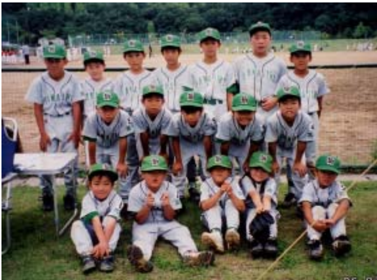
新調したユニホームで市子連中央大会I地区大会に出場し、よく頑張った花尻チーム

7月6日(日)午前8時30分より山田GPにおいて I地区育成会主催 第40回岡山市子ども会親善球技大会(I地区大会)開かれました。花尻チームも真新しいユニホームで出場し、予選リーグを勝ち上がり、決勝トーナメントに進みましたが、惜しくも4位となり市子連中央大会出場はなりませんでした。