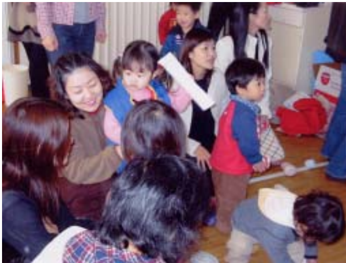
母親同士の話しも弾み有意義な公開はとぼっぽでした!

2月4日(火)公開はとぼっぽを花尻町内集会所にて行いました。誕生日のお友達の祝いをした後、紙芝居を見ました。紙芝居が終わると、玉入れ、プロツク、ぬり絵など自分のしたいことを選んで各自で遊びました。見学に来てくれたお友達も、自由に遊んで友達との交流を楽しんで