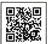
町内会 HP QR コード