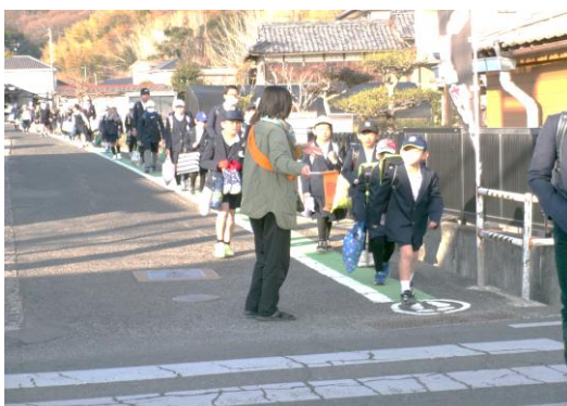
和田通学路(信号機)