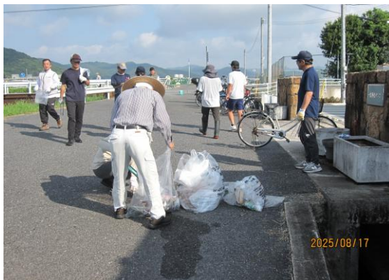
笹ヶ瀬川周辺のクリーン作戦