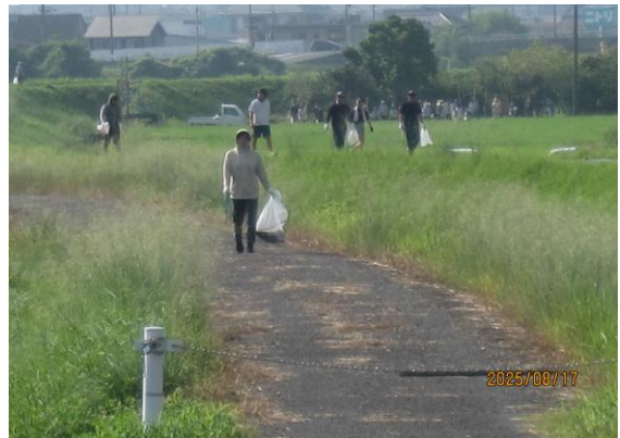
笹ヶ瀬川周辺のクリーン作戦