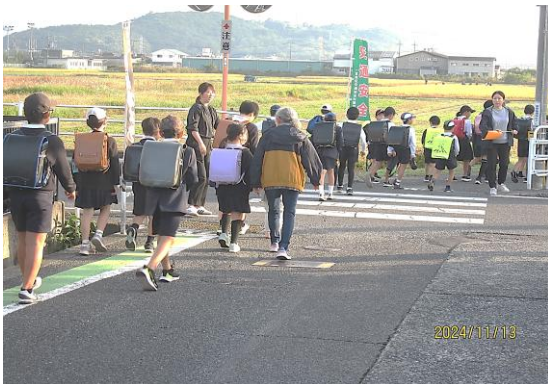
和田通学路(交差点)