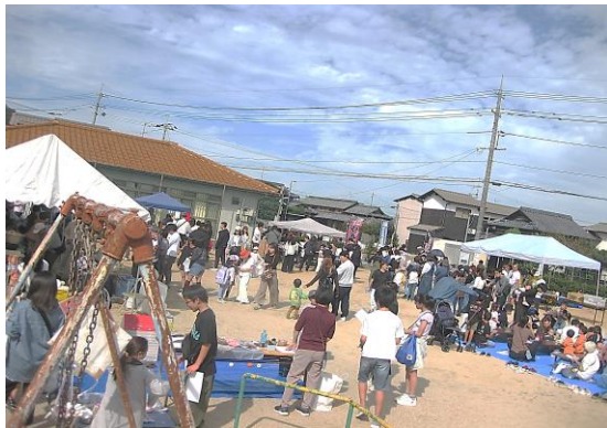
尾上中石公園の店舗

本年は、猛暑日が連続する大変暑い夏でしたが、爽やかな天候のもと令和6年10月26日(土)に、尾上公会堂、尾上中石公園から尾上八幡宮とその周辺で、第14回おのうえ秋まつりが盛大に実施されました。前日の尾上町内会広報車によるご案内から始まり、当日は小学校の行事の為、従来の開会式より少し遅い12時の開会式となりました。まず、ご来賓の方々のご挨拶を頂いた後、各小字町内会の出店の販売開始と同時にスタンプラリーをスタートしました。また龍王太鼓が、各所を演舞して廻り、まつりは一層、盛り上がりました。今年の特徴は、防災意識向上の一助となるブースの設置や各所の交通安全のための係員の増員などがあります。また、各出店の販売状況などは、逐次、本部に情報ように、SNS(Social Network System)アプリの活用も試みました。14時20分には、販売とスタンプラリーは終了し、お祭り参加者が尾上中石公園に集まり、大抽選会が行われました。公園内に集まった老若男女が抽選番号に集中し、種々の景品に注目する様子も、“まつり”の醍醐味と感じます。ちなみに、各小字毎の受付時の人数を集計すると584人との報告がありました。多数の老若男女のご参加有り難うございました。そして、翌日、尾上中石公園から尾上八幡宮のゴミ拾いにもご参加いただき、ミズなども含め、殆どゴミが無い事に感心しました。最後に、テント、机、椅子などの運搬から設営片付け等にご参加いただいた方々、そして、中学生のボランティアの方々に感謝申し上げます。