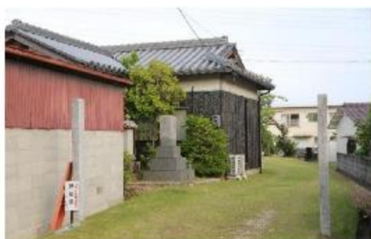
一時避難場所(妙見堂)

⑤中山小学校の東、横手堤からの越水により浸水被害が発生します。現在、白石ポンプ場の隣と今保地内に令和5年度の梅雨時期までに稼働する予定で新たな都市型の水揚げポンプ場が建設中です。これにより浸水被害は軽減できると思いますが、災害は想定する範囲を超えた被害をもたらします。自分が生活している地域がどのような災害リスクがあるかということを知ることが大切です。尾上地区では洪水の際の一時的に避難場所として、尾上公会堂・妙見堂・尾上八幡宮・神道山・ND大学一宮校舎・北浦中浦公会堂・徳寿寺を指定しています。尾上地区で被災された住民があった場合は、高齢者の避難誘導、炊き出しや災害ゴミの撤去作業など近隣の住民同士の協力や助け合いが大切になってきます。そのためには尾上町内会が企画する活動や行事にできるだけ参加していただき、互いが顔見知りになって住民同士の絆を深めてもらいたいと思います。