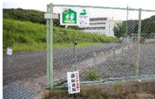
一時避難場所(ND大学一宮校舎)