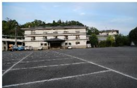
一時避難場所(神道山駐車場)