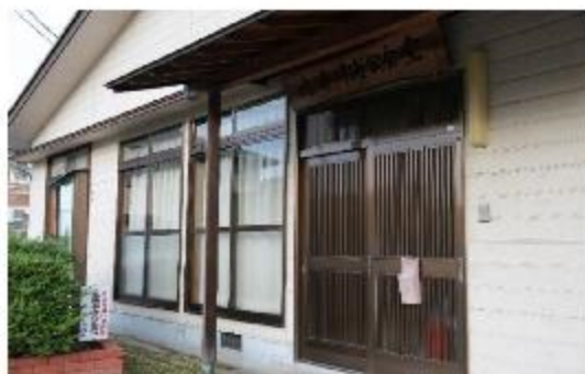
一時避難場所(北浦・中浦公会堂)