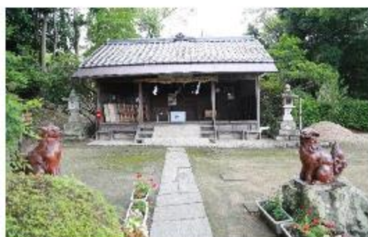
一時避難場所(尾上八幡宮)