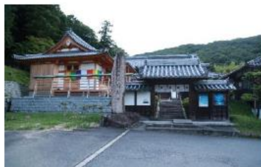
一時避難場所(徳寿寺)