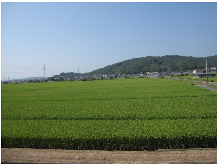
植え付けてから97日目(穂揃期)