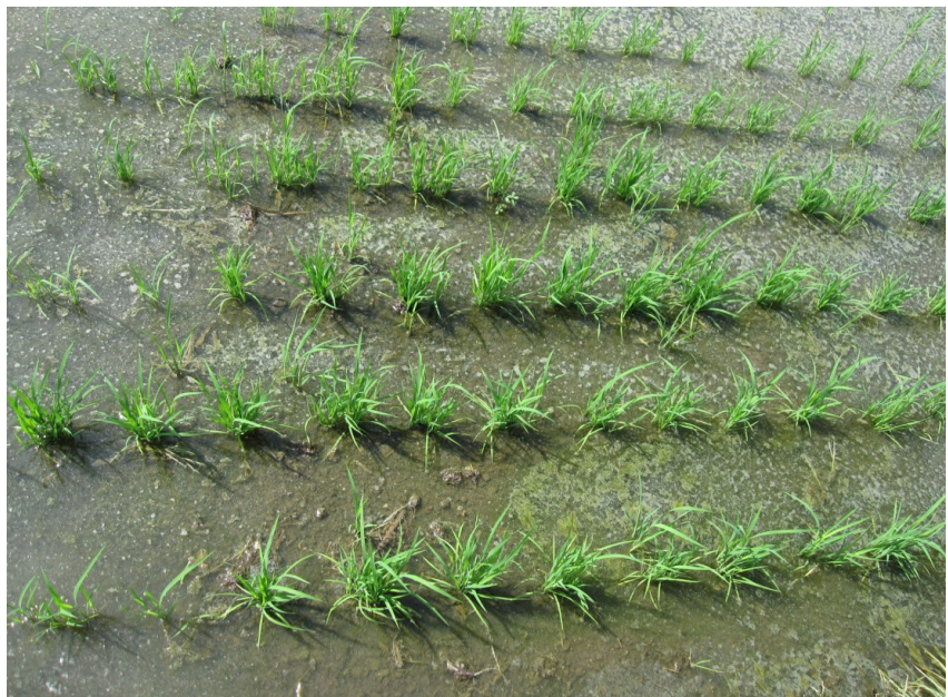
植え付けて16日後の苗