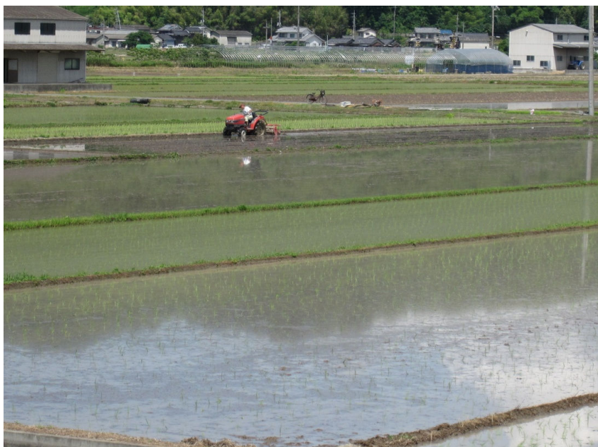
たんぼに水をはり田植え前のシロカキ作業