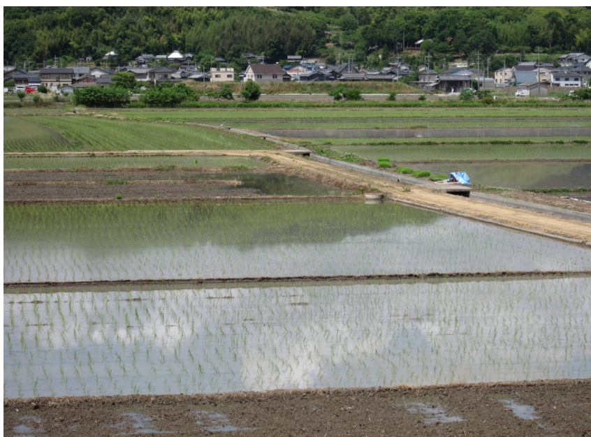
植え付けされた田園風景