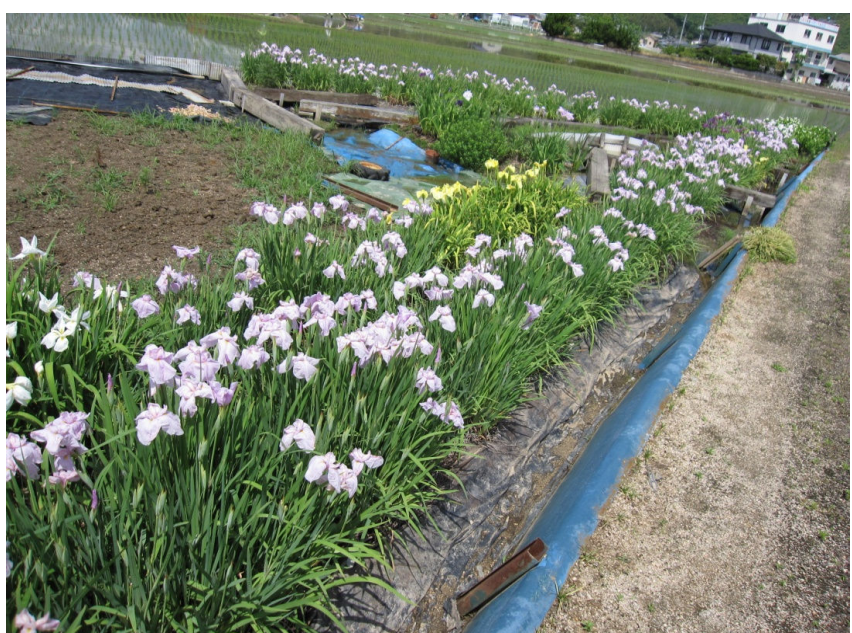
春の花も咲きほこっています