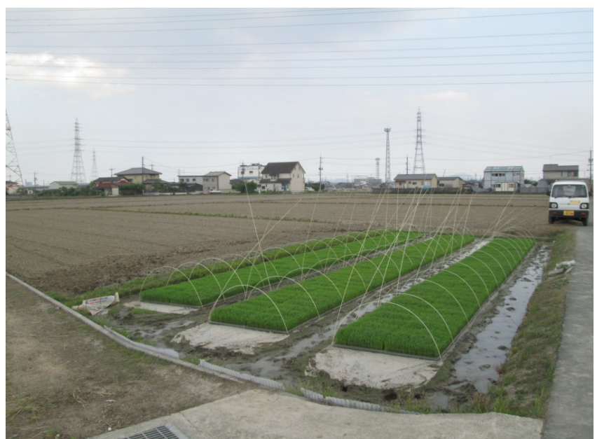
種まきから10日目の苗床(朝日70mm・ヒノヒカリ40mm)