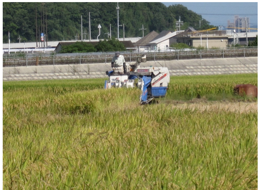
黄化した稲穂をコンバインで刈取り作業