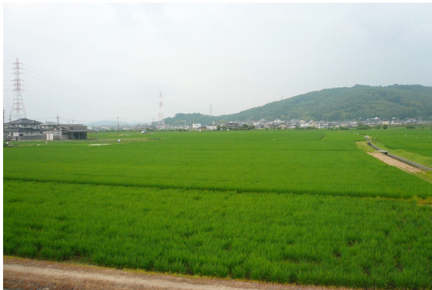
植え付けてから42日目