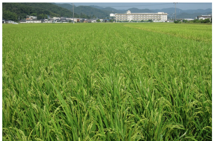
植え付けてから97日目(穂揃期)