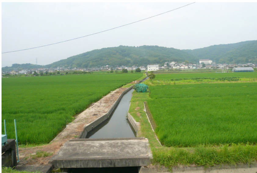
植え付けてから43日目