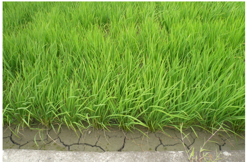
7月25日～8月4日まで土用干し(圃場の水を落とす)