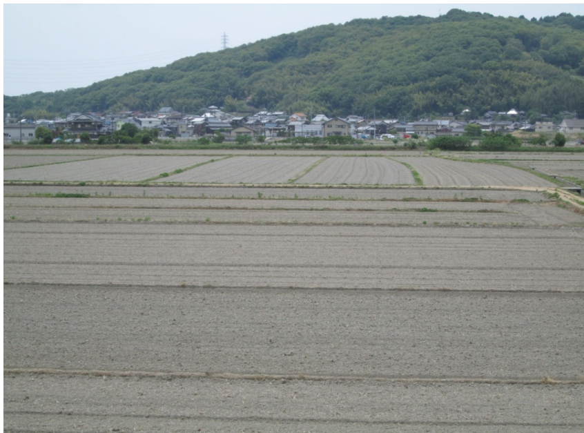
シロカキ前のきれいに整地されたたんぼ