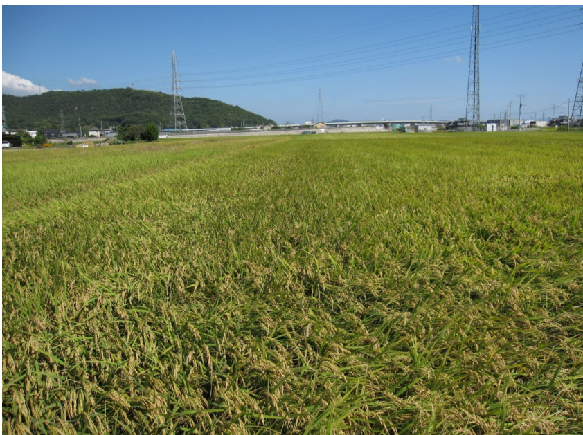
稲穂が黄化した尾上(成熟期)