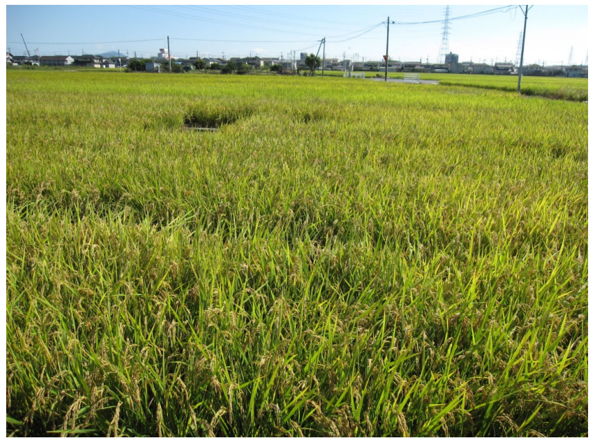
穂が黄化した稲(成熟期)