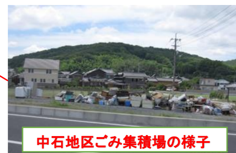
中石地区ごみ集積場の様子