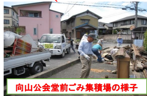
向山公会堂前ごみ集積場の様子