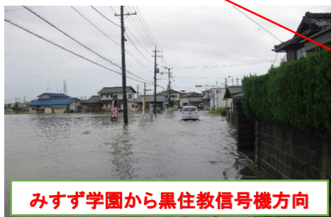
みすず学園から黒住教信号機方向