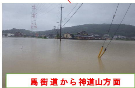
馬街道から神道山方面