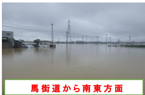
馬街道から南東方面