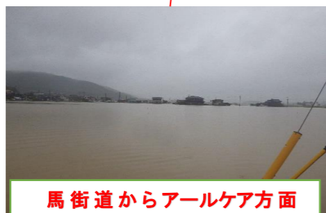
馬街道からアールケア方面