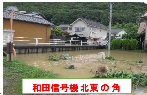
和田信号機北東の角