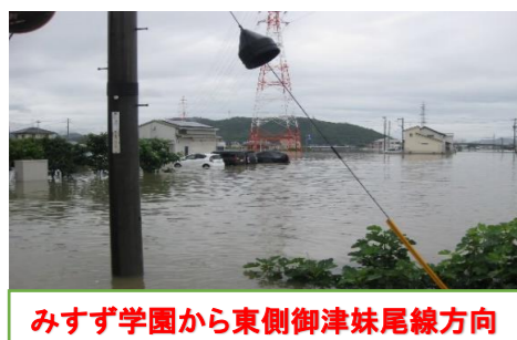
みすず学園から東側御津妹尾線方向