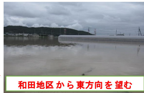
和田地区から東方向を望む