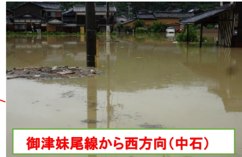
御津妹尾線から西方向(中石)