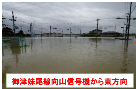
御津妹尾線向山信号機から東方向