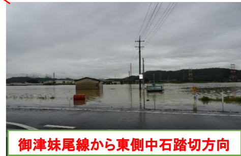
御津妹尾線から東側中石踏切方向