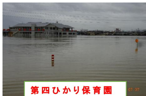
第四ひかり保育園