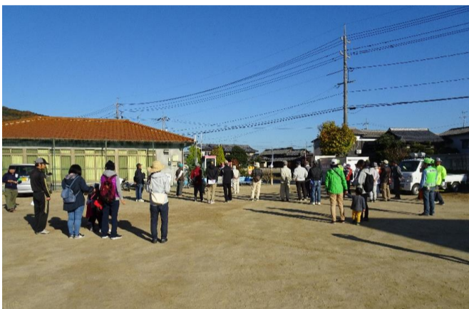
石原町内会長挨拶

尾上中石公園に集合し、開会式後ABのコース分かれ散策し、東花尻公会堂で合流し休憩親睦会が実施後グループ毎出発し、尾上八幡宮には約2時間後、全員無事到着しました。 町内会からのパンと飲み物が配られ、集合写真が撮られ、解散となりました。 参加された皆さんご苦労様でした。お世話いただいた関係者の皆さんありがとうございました。