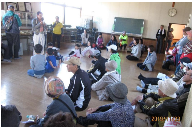
東花尻公会堂(クイズ)