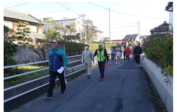
A・Bグループに分かれスタート