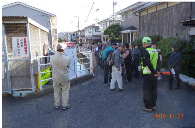
尾上の舟溜まり(中石地区)