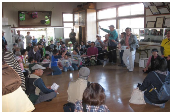
東花尻公会堂(親睦)