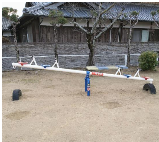
★緑町公園のシーソー