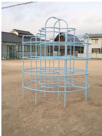
★中央公園のジャングルジム