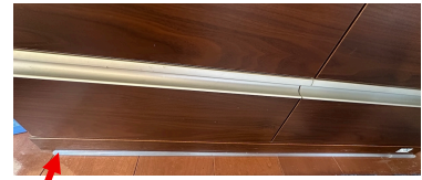
設置例（耐震ストッパー）

①から③は、単体では④に及びませんが、例えば①と③を併用することで、ほぼ同等の効果が期待できるようです。これなら壁や家具を傷つけなくて済みます。