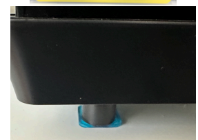
設置例（耐荷重は4枚で36kg）