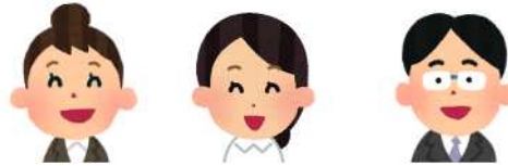
保健師・看護師 社会福祉士 主任ケアマネジャー