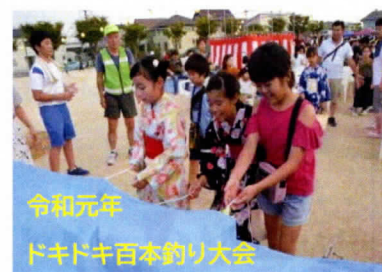
令和元年 ドキドキ百本釣り大会