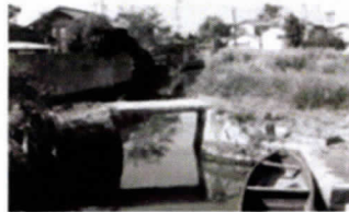
田中野田の昔～未来へ 2022/12/15