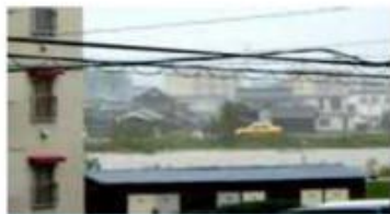
写真は昨年10月20日の台風23号のときの笹ヶ瀬川の水位

本年度は、岡山市において安全・安心のまちづくりに備え、防災監視システムを構築し、その情報をITを使って提供しようとしています。我が町内には、笹ヶ瀬川の堤防の危険、内水面の水位上昇に伴う床下・床上浸水に関する不安がありますが、このシステムにより適切な情報などが提供されることになれば有り難いことです。