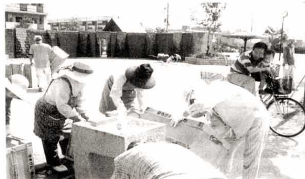
《写真》上：辰巳西公園に新設された時計 中：春期(5/6・日)町内の公園清掃作業 一除草一 下：(同上)一分別収集用コンテナの洗浄一