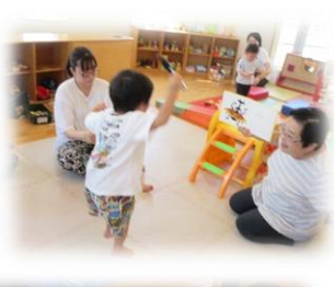
『なかよし広場』夏祭り☆GO

読み聞かせボランティアの先生方が来てくれています。季節のお話や大型絵本・紙芝居などいろんなお話をしてくれているので、毎月楽しみです。