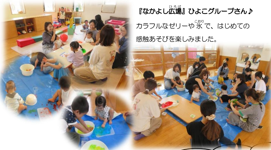
『なかよし広場』ひよこグループさん♪