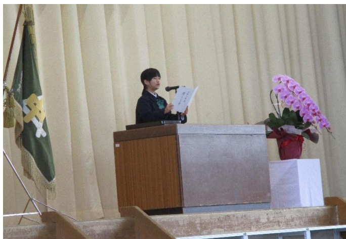
在校生代表から「卒業生に贈る言葉」