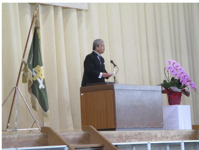
塩江校長から「はなむけの言葉」