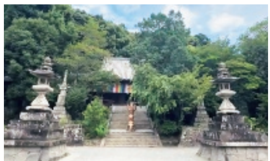
▲四国八十八ヶ所霊場第五十一番札所 熊野山 虚空蔵院 石手寺

事に子どもが生まれたら、新しい石にその子の名前と生年月日を書き、石を2つにして返すのがならわしです。 もう一つの見どころは冒険気分も味わえる有り難い神秘のマントラ洞窟で、長さは160メートルあります。お参りの際はぜひ洞窟に