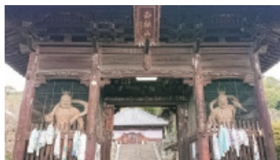
▲ 四国八十八ヶ所霊場第四十九番札所 西林山 三蔵院 浄土寺

珍しいレンガ造りになっており、他にはない祠です。四国八十八ヶ所霊場第四十九番札所 西林山三蔵院 浄土寺は愛媛県松山市の鷹子町にあり、真言宗豊山派でご本尊は釈迦如来に なります。「三蔵院」と呼ばれる由来は、浄土宗の開祖「円光大師」、二世「聖光上人」、三世「良忠上人」の自作の像が安置されていたからですが、残念ながらこちらの三像は、昭和20年の松山空襲で開帳先のお寺で焼失しています。