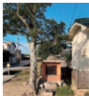
▲ 沖新田第四十九番札所

沖新田八十八ヶ所第四十九番札所は、前回の四十八番札所から離れた所であり、五十一番札所と五十二番札所の中間にある用水沿いの民家の横にあります。写真には木が写っていますが、現在は倒されてしまっているようです。この祠は