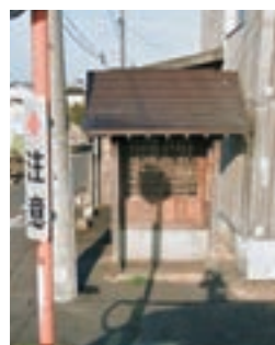
▲ 沖新田第四十八番札所

沖新田八十八ヶ所第四十八番札所は、山陽新聞光政販売所から百間川と反対方向に歩き、最初の十字路の左側にある茶色い屋根の祠です。歩いてきた道をそのまままっすぐ進むと県道383号線に出ることが出来ます。