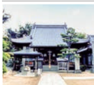
▲ 四国八十八ヶ所霊場第四十八番札所 清滝山 安養院 西林寺

今でも枯れることなく水が湧き出ていて、泉のほとりには弘法大師の像がたてられています。昭和60年には「全国の名水百選」にも選ばれている弘法大師の伝説の泉にお立ち寄り下さい。