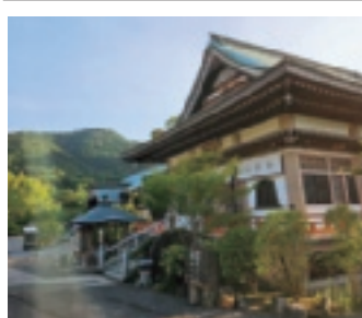
▲ 四国八十八ヶ所第四十七番札所 熊野山 妙見院 八坂寺