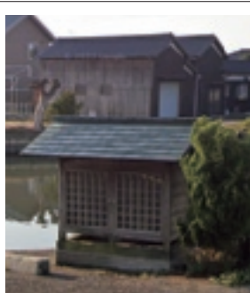
▲ 沖新田第四十七番札所

四国八十八ヶ所霊場第四十七番札所熊野山妙見院八坂寺は愛媛県松山市浄瑠璃町八坂にあり、真言宗醍醐派でご本尊は阿弥陀如来になります。