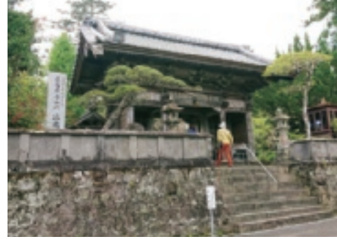
▲ 四国八十八ヶ所三十九番札所 赤亀山 寺山院 延光寺