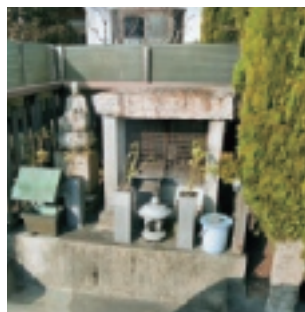
▲ 沖新田第三十八番札所

沖新田第三十八番札所は、百間川の河口東側付近にある横樋海岸の湾の中に浮かぶ横樋観音の近くにあり、民家に引つづくように寄り添って祠があります。とても綺麗に祀られており地域の方々が大切にされているのがよくわかります。横樋観音は「海から引き上