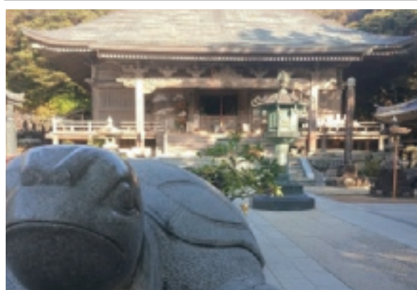
▲ 四国八十八ヶ所第三十八番札所 蹠跣山 補陀洛院 金剛福寺

げられた横樋観音」として有名で、当時は県外からバスで参りに来る人々で賑わっていた。(詳しくは改めて紹介したいと思います。) 四国八十八ヶ所第三十八番札所 蹠跣山 補陀洛院 金剛福寺は高知県土佐清水市足摺岬にあり、本尊は三面千手観世音菩薩です。 このお寺は四国最南端の岬にあるお寺で、三十七番札所からは片道約83キロあります。また、次の札所に行くためにはもと来た道を戻るため、合計約150キロの長旅になり「お遍路さん泣かせ」とよく言わ