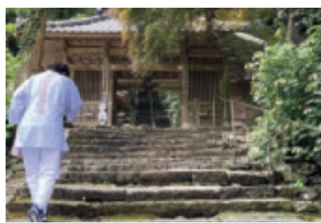
▲ 朝青龍がトレーニングしていた階段

です。こちらのお寺は甲子園出場校で有名な明德義塾高等学校の近くでこの高校の卒業生である元横綱、朝青龍が青龍寺の170段ある階段をしいトレーニングをしていたそうです。そしてお寺の名前が朝青龍の「しこ名」の由来になつたお寺です。