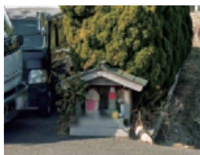
▲ 沖新田第三十六番札所

四国八十八ヶ所第三十六番札所 独鈷山 伊舎那院 青龍寺は高知県土佐市にあり、本尊の波切不動明王は、空海が乗った遣唐使船が入唐時に暴風雨に遭つた際、不動明王が現れて剣で波を切つて救つたといわれ、空海がその姿を刻んだものであると伝えられています。