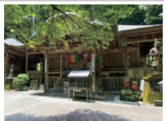
▲ 四国八十八ヶ所第三十六番札所 独鈷山 伊舎那院 青龍寺

です。こちらのお寺は甲子園出場校で有名な明德義塾高等学校の近くでこの高校の卒業生である元横綱、朝青龍が青龍寺の170段ある階段をしいトレーニングをしていたそうです。そしてお寺の名前が朝青龍の「しこ名」の由来になつたお寺です。