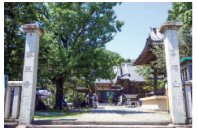
▲ 四国八十八ヶ所 第三十三番札所 高福山 幸福院 雪蹊寺