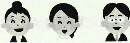
保健師・看護師 社会福祉士 主任ケアマネジャー