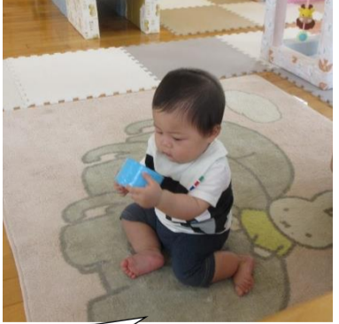
のぞいてみたり・・・