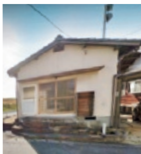
▲沖新田第三十一番札所