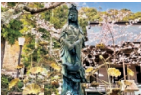
▲四国八十八ヶ所 第三十一番札所 五台山 金色院 竹林寺

知県高知市の五台山にあります五台山 金色院 竹林寺 になります。ご本尊は文殊菩薩になります。竹林寺は春には桜、苔の絨毯と緑に囲まれた石段、秋には美しい紅葉。どの季節に足を運んでも飽きない美しさがあり、国指定名勝庭園など見どころが多いお寺です。令和5年の今年には開創1300年になります。50年に一度の御開帳と定められている日本三文殊随一の秘仏のご本尊が4月15日〜5月14日まで特別にご開帳されるそうです。（次回御開帳は2064年）竹林寺ではいろいろな体験もさせていただきます。お遍路体験、瞑想と写経、子どもたちの一休さん修行などなどHPをぜひチェックしてみてください。