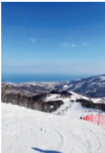
▲朝里川温泉山頂からの眺め

2日間朝里川温泉で過ごし、3日目は手稲オリンピアスキー場に移動。ここは、1972年にアジア初の冬季オリンピック会場になった場所。ゲレンデの一角に聖火台がありました。こちらにも札幌からわずか15キロの位置にあり、手稲山の山頂からの眺めも絶景：のはずがこの日はずっと吹雪。わずかな雲の切れ間に一瞬の眺望が見えたものの、リフトに乗っている