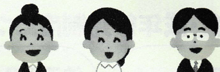
保健師・看護師 社会福祉士 主任ケアマネジャー