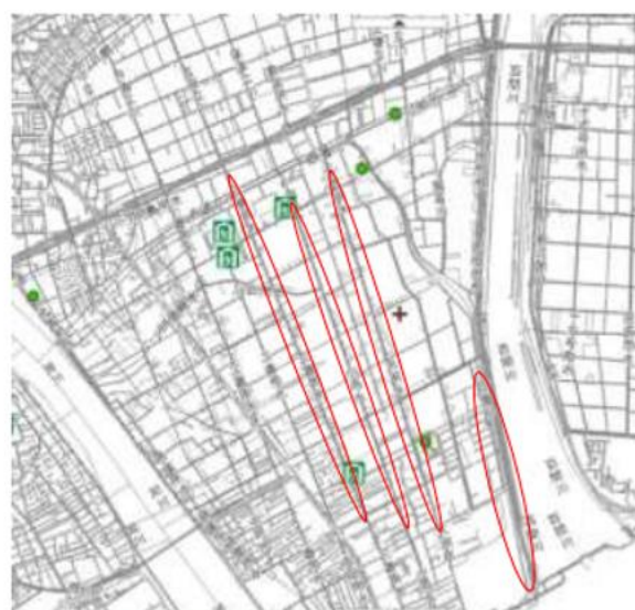
操南中～四番川 (三番用水・大用水)