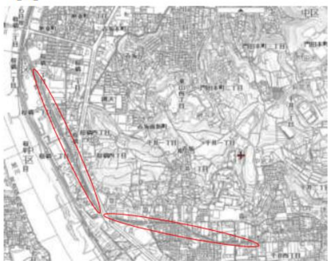
岡大附属中～倉安川