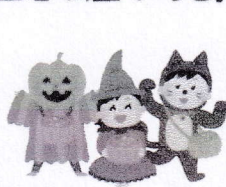
季節のイベント(七夕・運動会・ハロウィン・クリスマス)