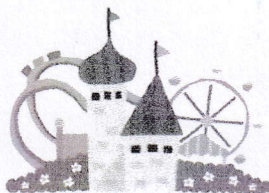
お出かけ(遊園地・公園・いちご狩り)