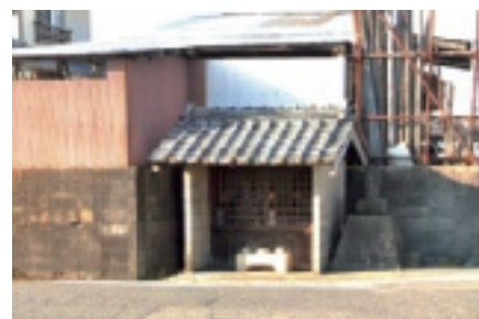
▲ 沖新田二十二番札所 ※瓦屋根の祠(ほくら)が二十二番札所です。

皆様こんにちは。今回は沖新田二十二番札所の紹介です。この札所は桑野ふれあいセンター横の用水沿いを北に歩き山陽病院のある通りを左に折れると道路沿いにあります。