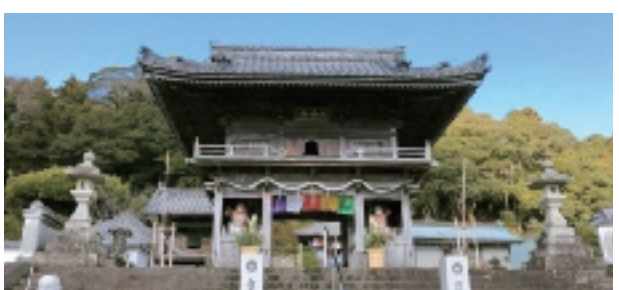
▲ 四国八十八ヶ所 二十二番札所 白水仙 医王院 平等寺

四国八十八ヶ所第二十二番札所は、白水仙 医王院平等寺です。平等寺は徳島県阿南市新野町にあります。ご本尊は薬師如来で、「あらゆる人々の心と身体を癒すこと」を祈り、弘法大師がお作りになりました。以前は秘仏でし