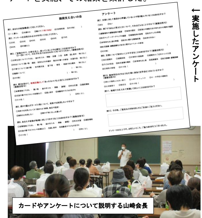
←実施したアンケート

に用途が違う。令和3年、愛育委員と町内会長に協力を依頼し、75歳以上の町内会加入者の人を対象に配布。また、併せて地域の現状を知るためのアンケートを実施、その結果を集計した。